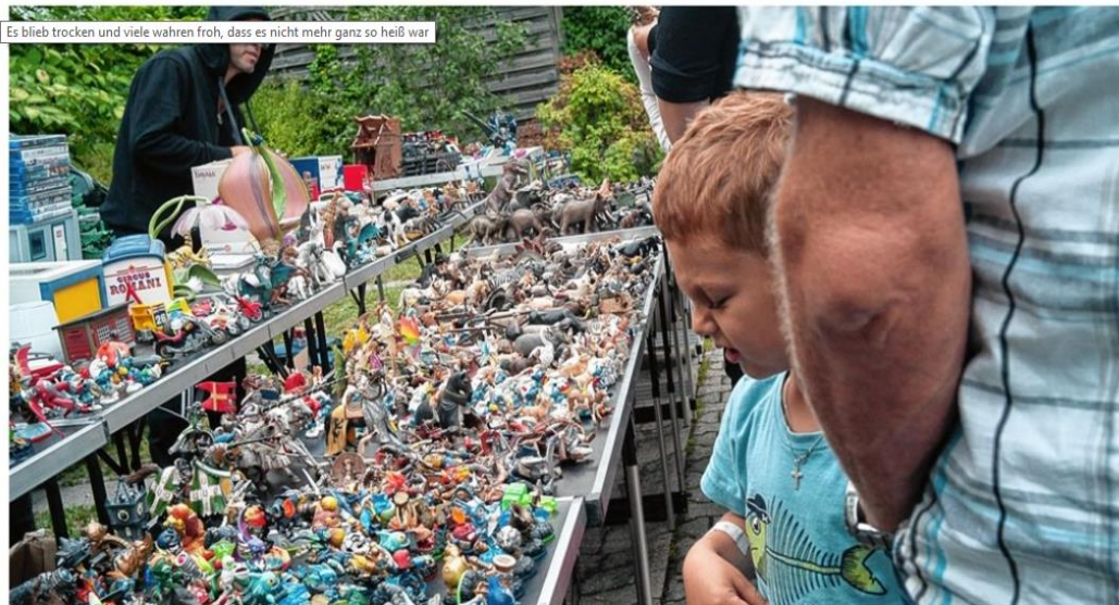
Es blieb trocken und viele waren froh, dass es nicht mehr ganz so heiß war