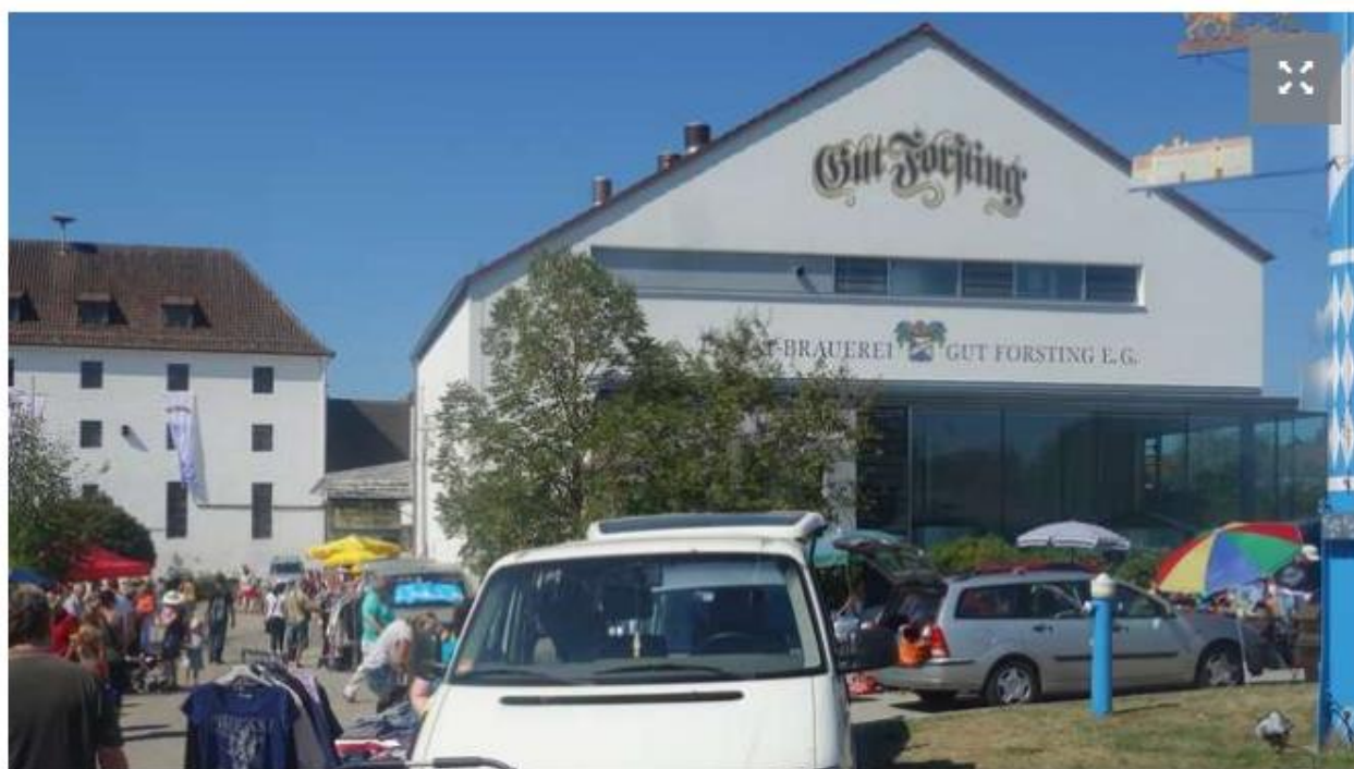
Der Forstinger Flohmarkt geht rund um die Brauerei

Pfaffing (Landkreis Rosenheim) - Dieser Jahres-Markt findet auf jeden Fall am kommenden Samstag, 25. August von 8 bis 16 Uhr statt, denn einen Ausweichtermin gibt es nicht.